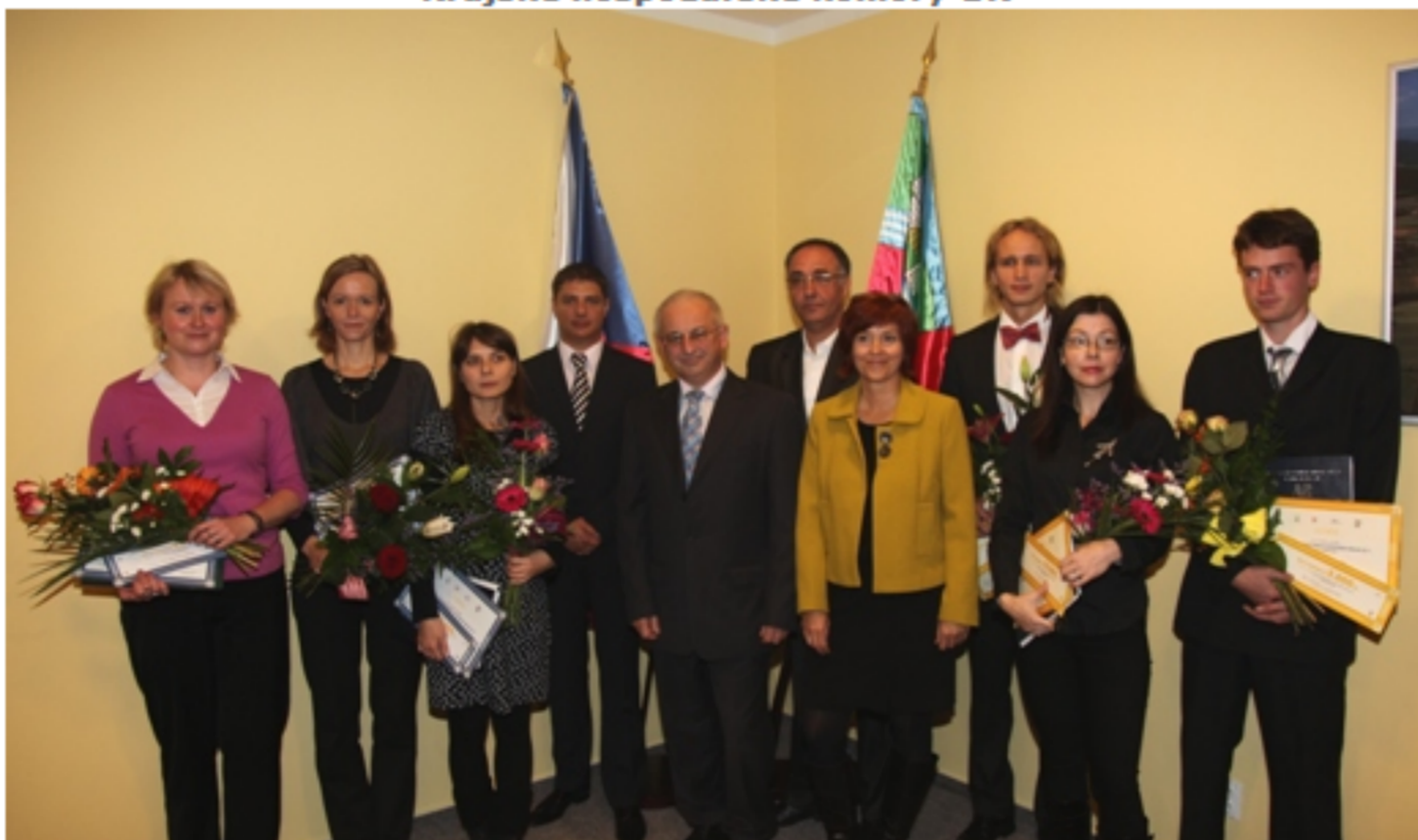
Organizátoři se všemi oceněnými studenty