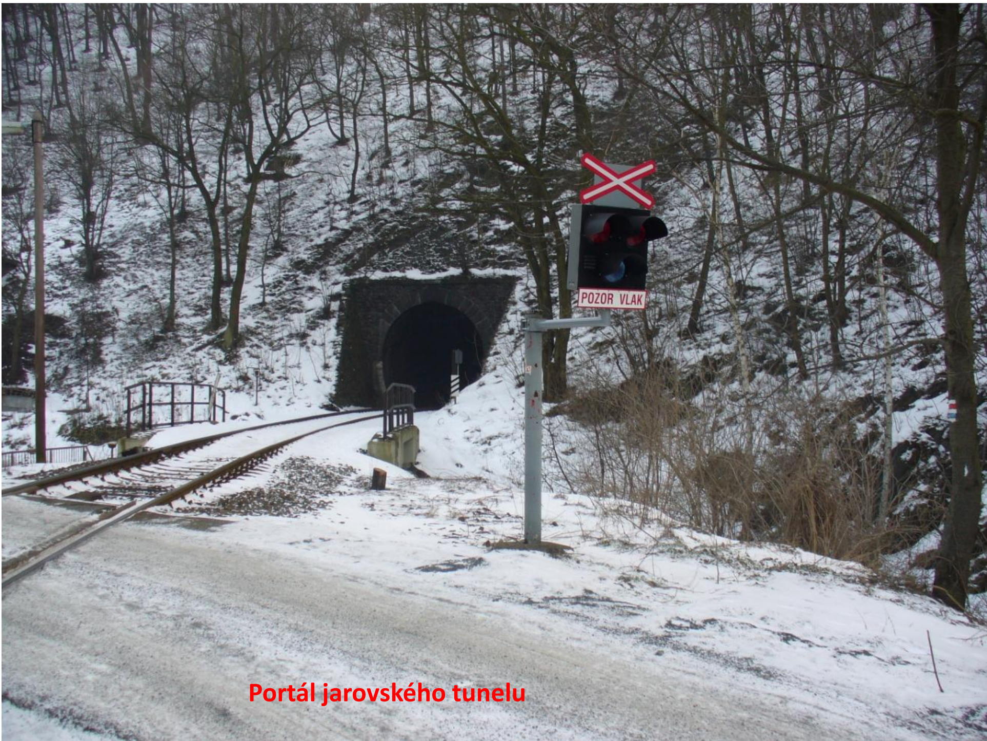
Portál jarovského tunelu