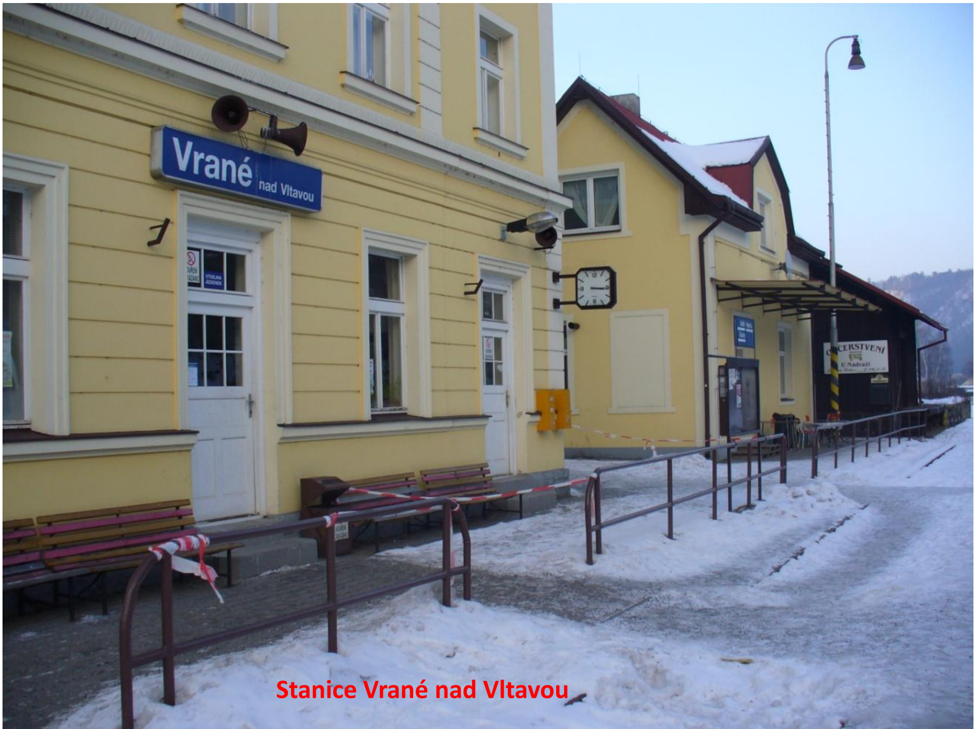
Stanice Vrané nad Vltavou