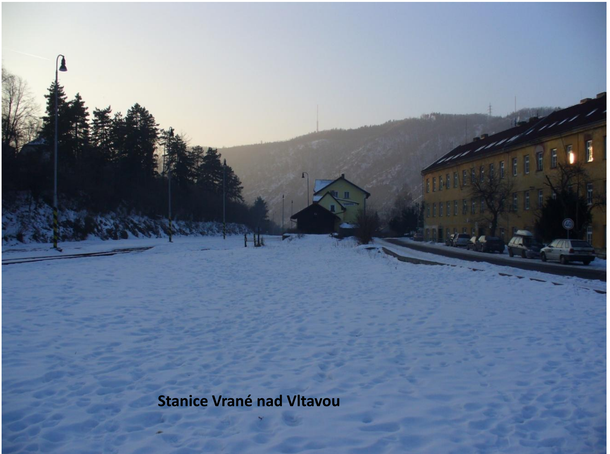
Stanice Vrané nad Vltavou