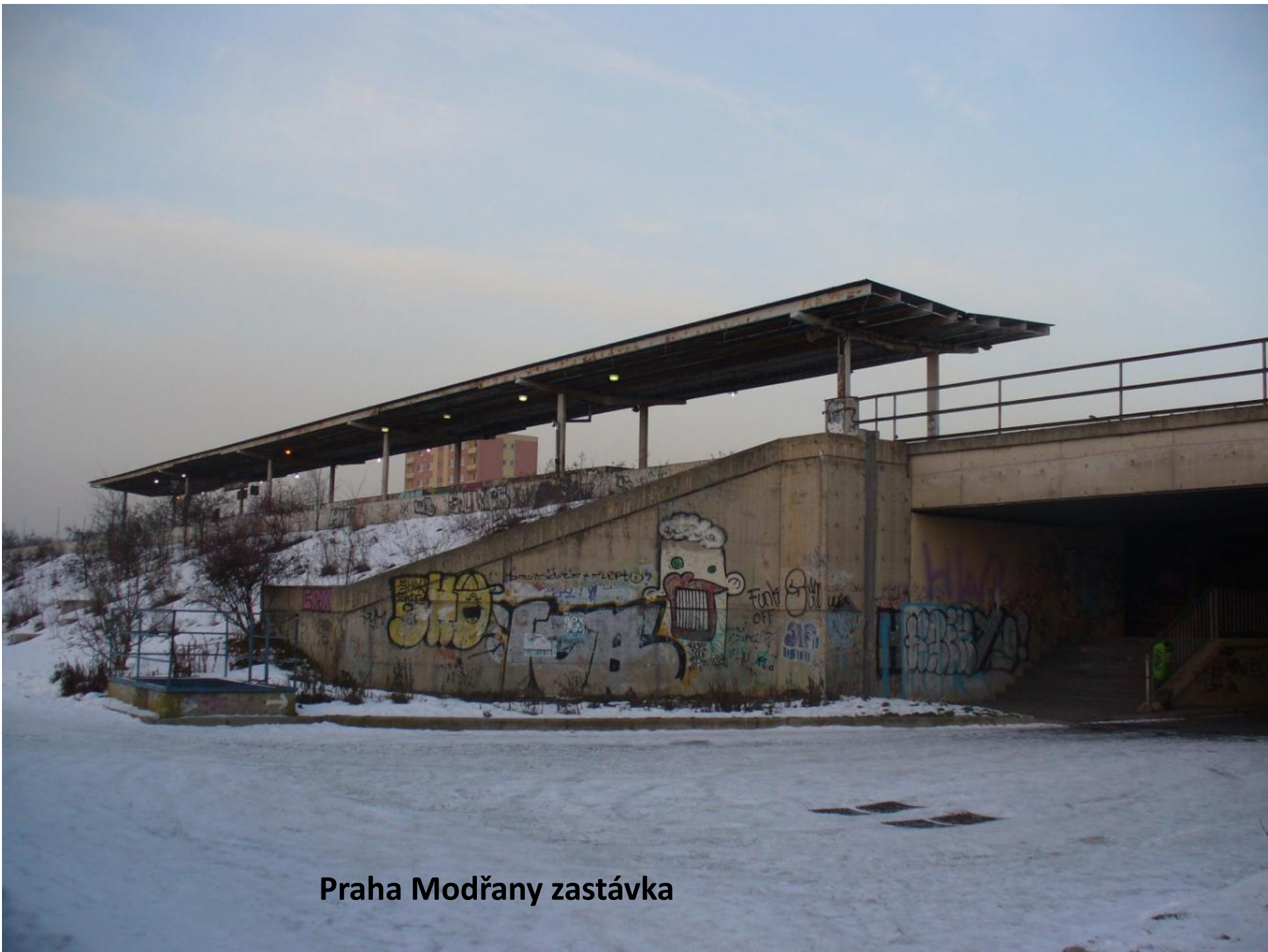
Praha Modřany zastávka