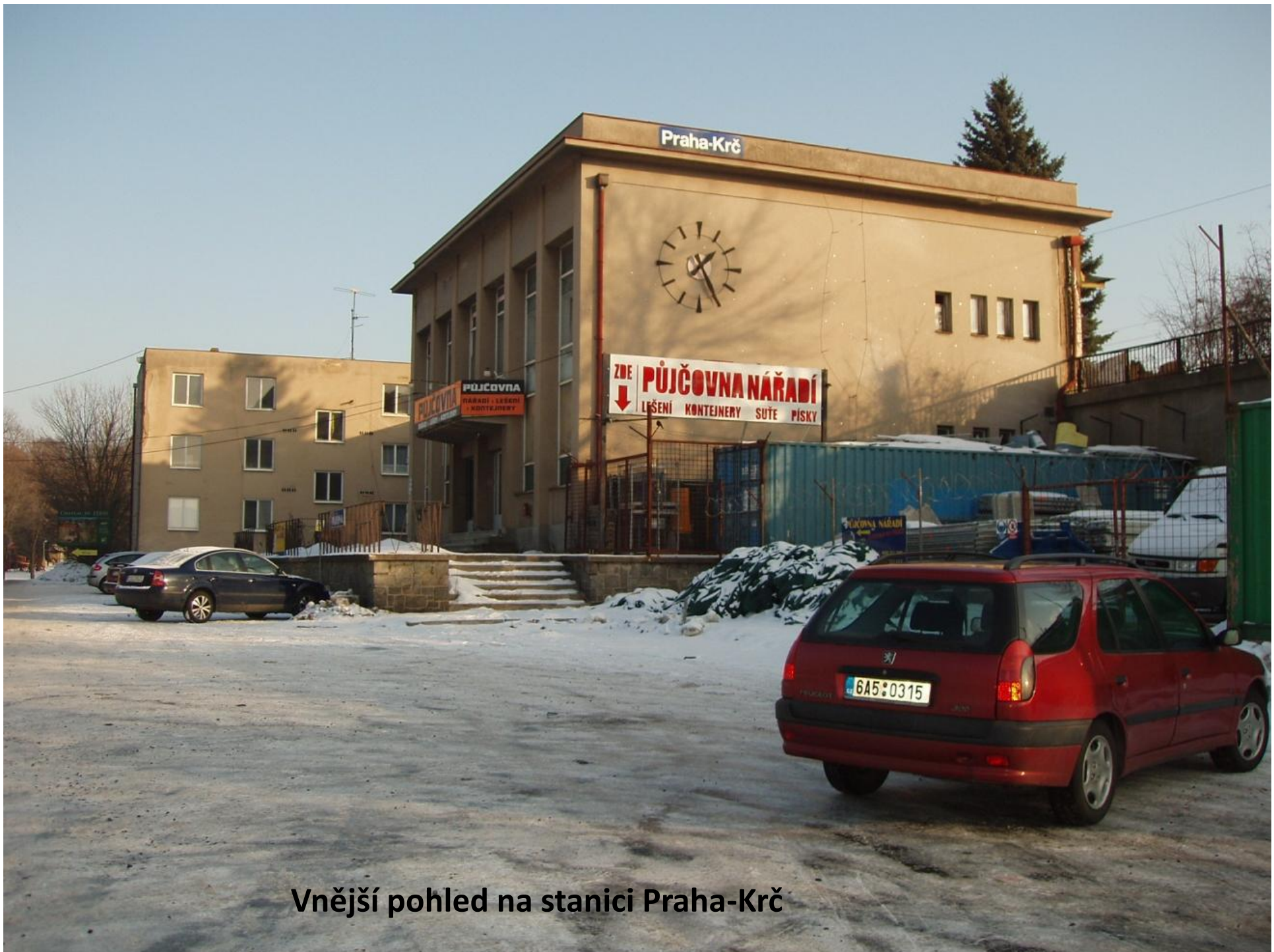
Vnější pohled na stanici Praha-Krč